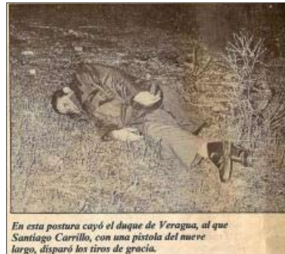
En esta postura cayó el duque de Veragua, al que Santiago Carrillo, con una pistola del nueve largo, disparó los tiros de gracia.

Diario Ya. Mostramos a continuación un artículo publicado en Diario Ya en 2010 y 2011, en un momento histórico en el que, por fallecimiento de Santiago Carrillo, se están sacando informaciones a nuestro juicio inexactas o erróneas de algunos hechos que formaron parte de su historia personal, y de la historia de España, como consecuencia de nuestro compromiso periodístico de mostrar la verdad de los acontecimientos como sucedieron, narrados a través de un documento de gran calidad informativa y documental.